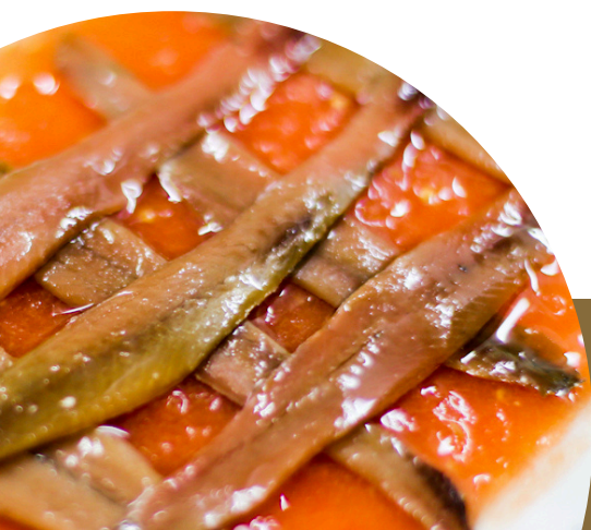
Anchoas de Santoña sobre cama de tomate