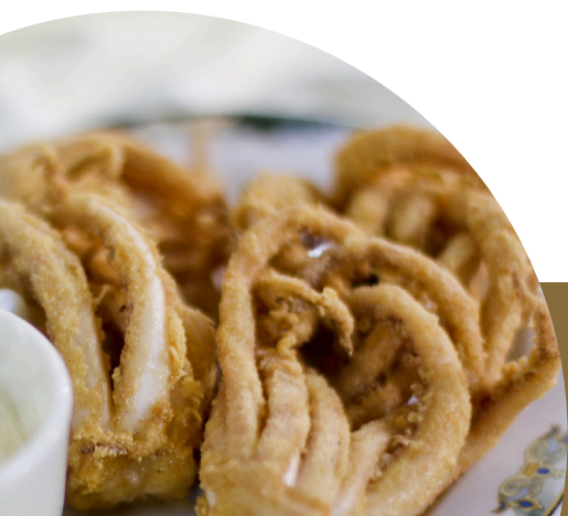
Rejos (patas de calamar)